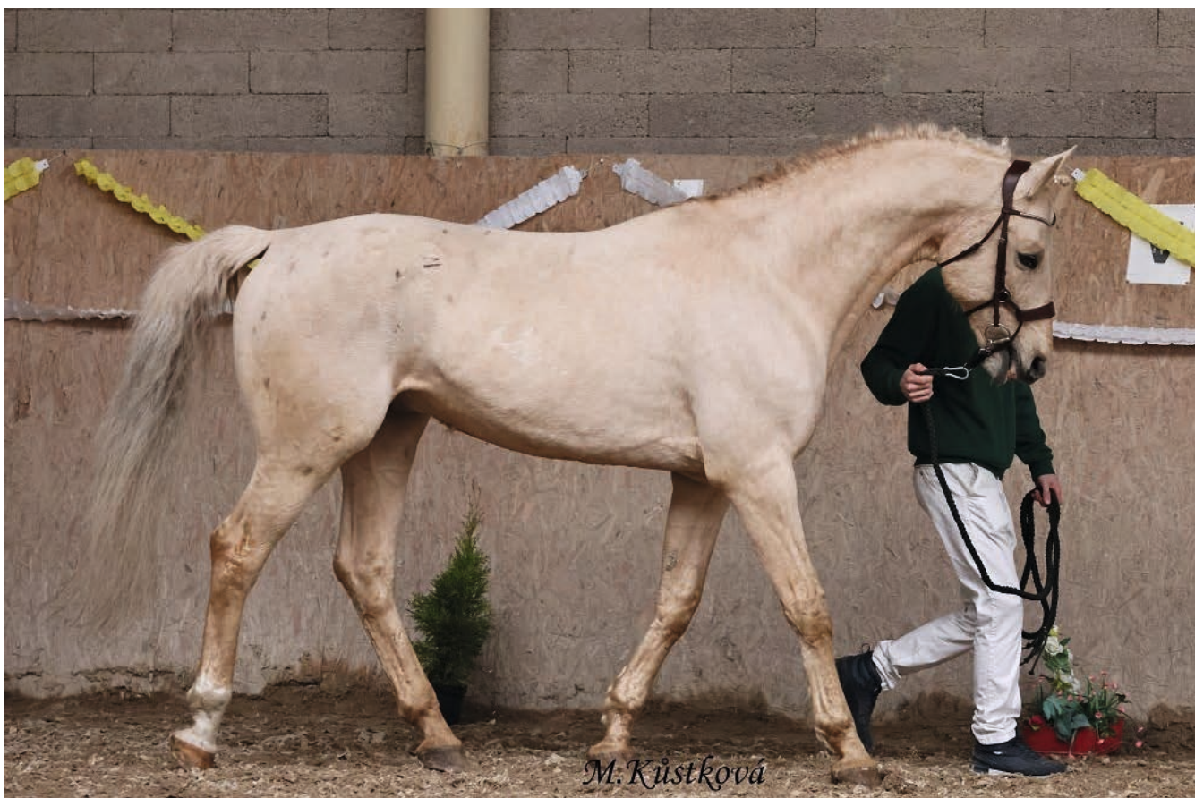
Spálené Poříčí, XXVI. Ročník Přehlídky hřebců, 2459 Pigment Kinský