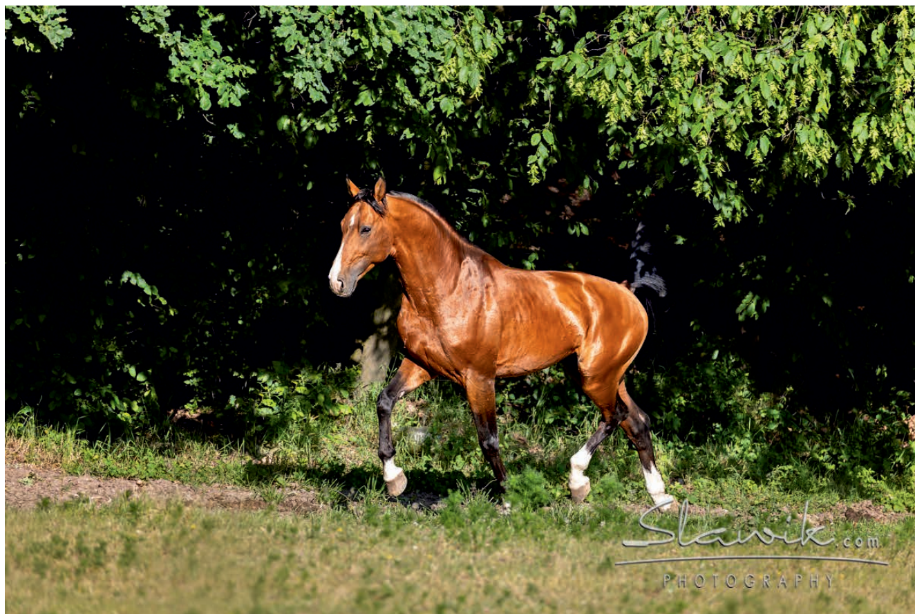
Plemenný hřebec Nathan.