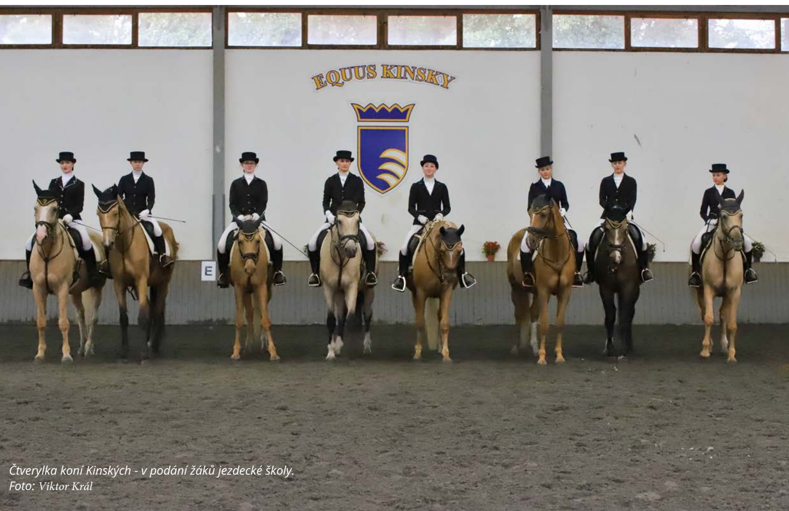
Čtverylka koní Kinských - v podání žáků jezdecké školy.