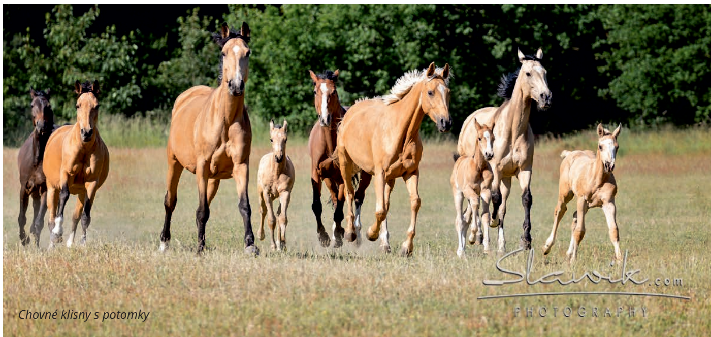
Chovné klisny s potomky